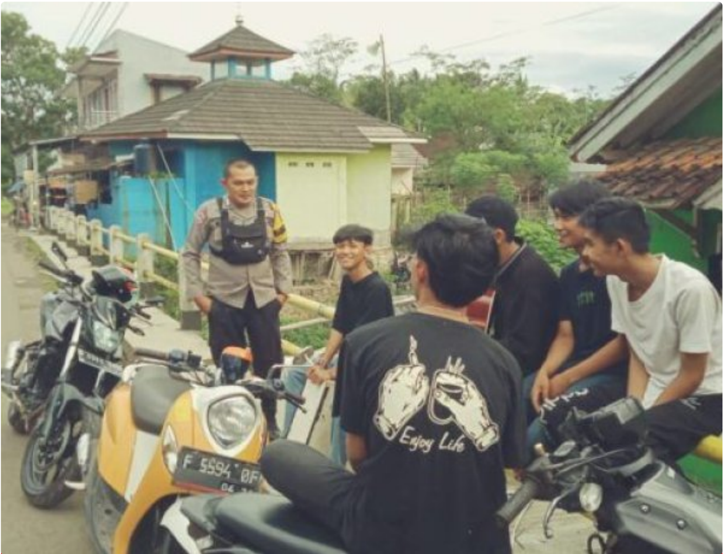
Polsek Cireunghas Polres Sukabumi Kota

Kota Sukabumi – Polres Sukabumi Kota Polda Jawa Barat – Polsek Cireunghas melaksanakan kegiatan dialogis dengan para pengemudi angkutan umum di jalan sempur, Selasa (30/1/24). Kegiatan ini bertujuan untuk menyampaikan himbauan